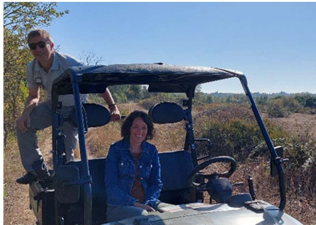
Visite RNN de l'Estagnol

Afin de valider la réalisation de ces travaux, une visite sur la RNN a été organisée le 10 octobre 2023 en présence du Conservatoire d'Espaces Naturels d'Occitanie, de l'Office Français de la Biodiversité (OFB), de la Région Occitanie et de l'EPTB Lez.