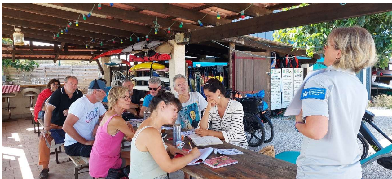
Les guides bénévoles de PKM et les intervenantes