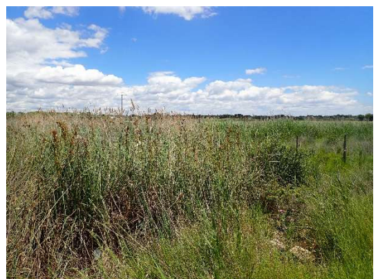
Marais à Cladium (7210*)