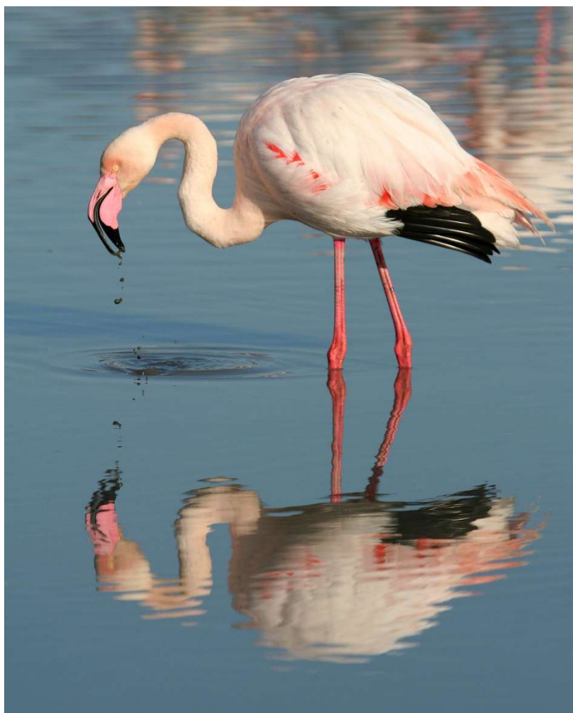
Flamant Rose (Phoenicopterus roseus)