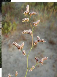
Salabelle de Girard