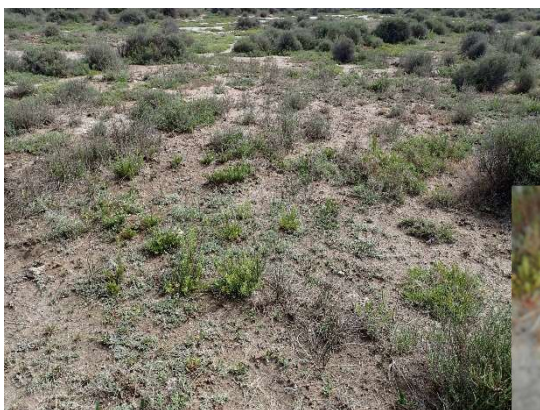
Steppes salées méditerranéennes (1510*)