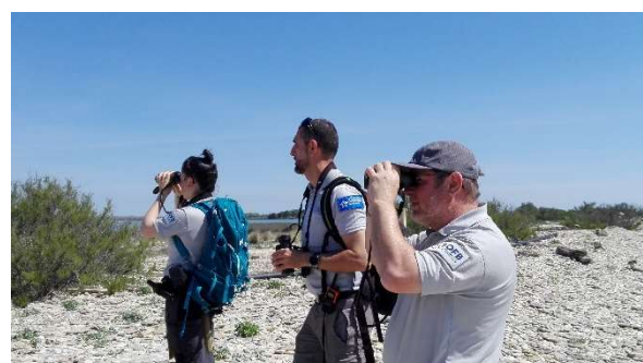
Agents de l'OFB, CEN Occitanie, SYBLE le 8 mai 2021