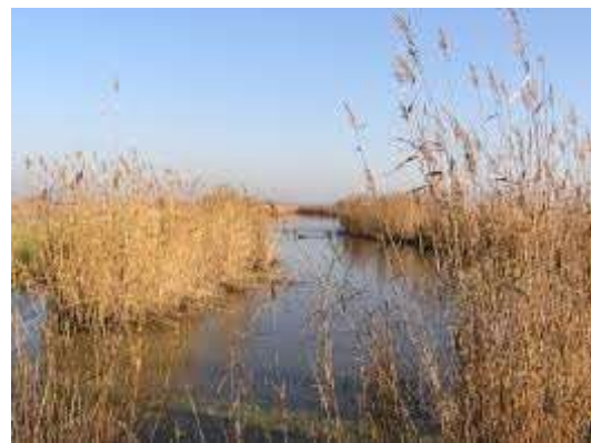
Roselière – habitat d'oiseaux