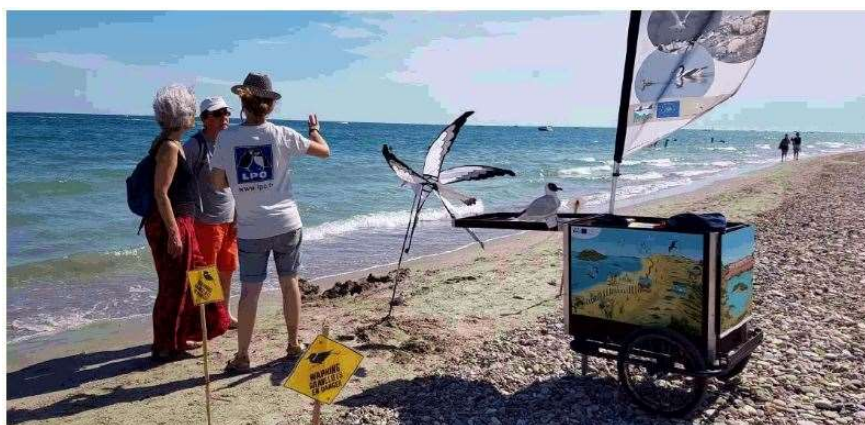
La LPO sur le lido en animation avec la laromobile