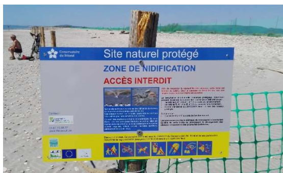
Panneau d'information installé sur le lido